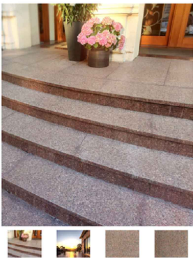
ILUSTRACJA POGLĄDOWA -okładzina płyty granitowe wg projektu

Schody przednie: -na inwentaryzowanym rzucie oznaczono projektowane spadki